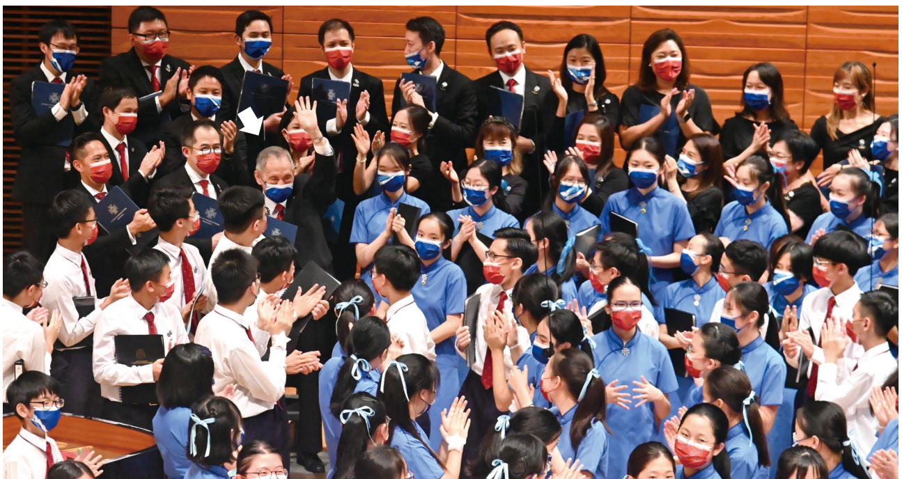
九十七歲的大師兄。