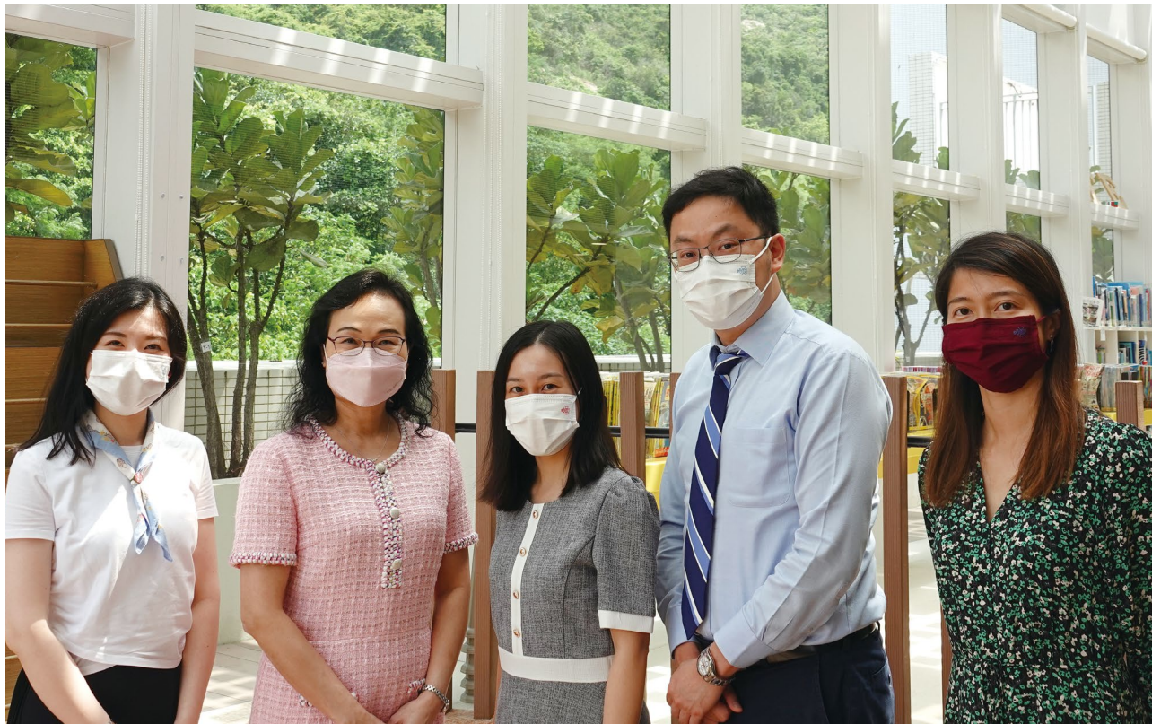
張校長與訪問團隊合照。