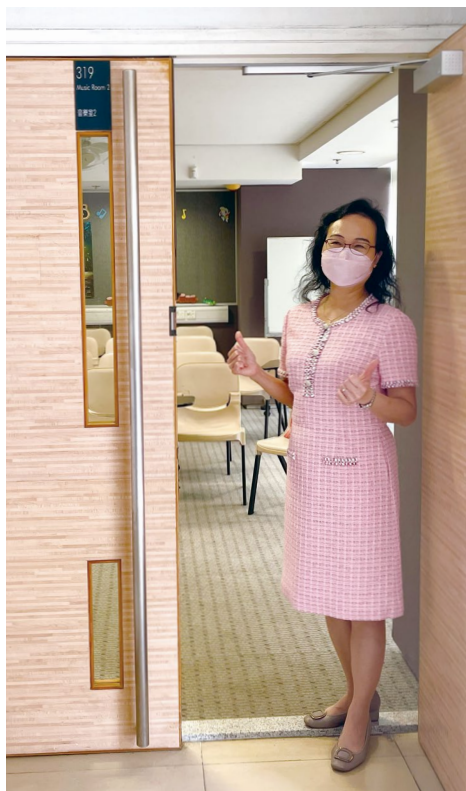
張校長說，319 室是她多年來和學生一同奮鬥的地方，充滿了美好的回憶。