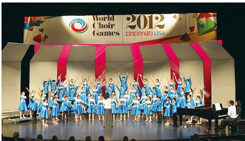
2012 年參加美國 Cincinnati World Choir Games 比賽。