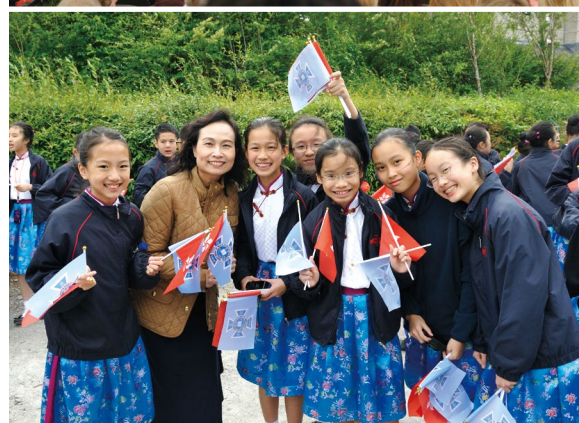
2015 年 7 月合唱團到英國參加 The Llangollen International Musical Eisteddfod 音樂節及活動後巡遊活動。