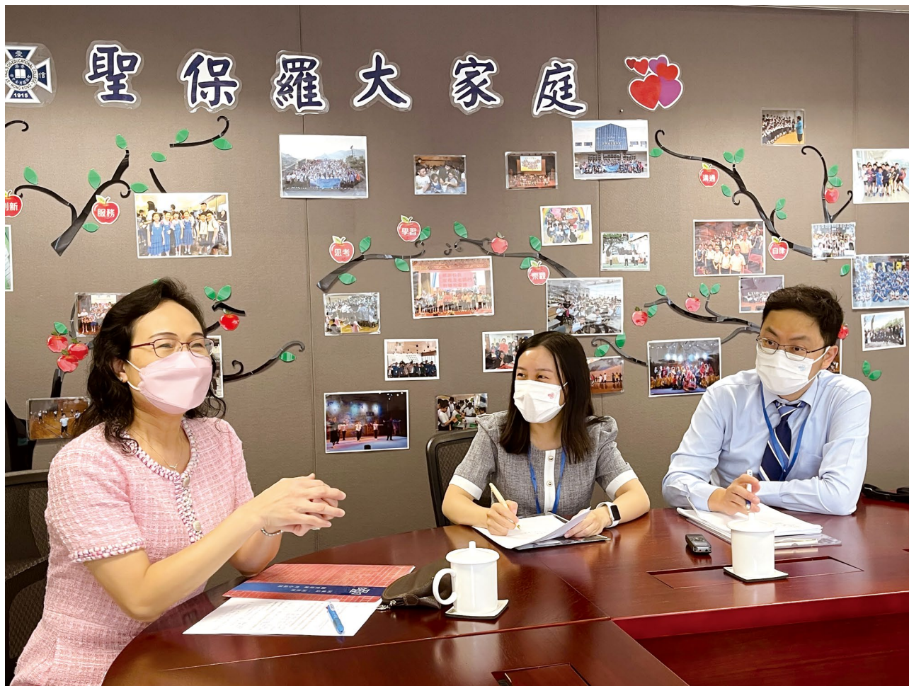
一次訪談，令我們發現張校長其實是外冷內熱——對音樂、信仰、孩子的牧養、聖保羅這一家都充滿熱誠和承擔。