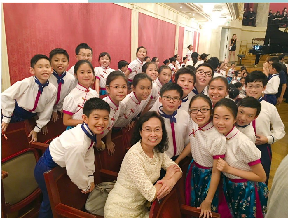
2017年7月合唱團於維也納舉行的 Summa Cum Laude 國際青年音樂節優勝者音樂會中演出後拍照留念。